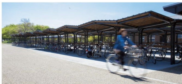
A7 駐輪場デザイン（学生共同作品・DSA 賞受賞）