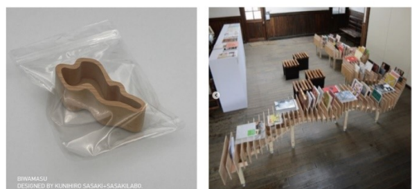
びわ湖材を用いた枡の商品開発 アールブリュット展・展示什器