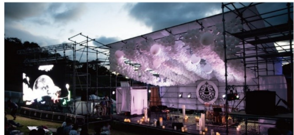
伊吹の天窓ステージセットデザイン（学生共同作品）