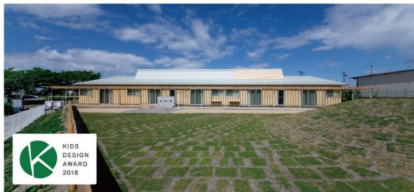
D 保育園デザイン（キッズデザイン賞受賞）