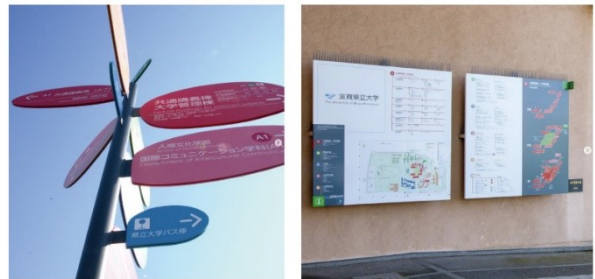
滋賀県立大学サインシステムデザイン